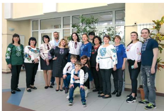
КНП «Центр первинної медико-санітарної допомоги № 2» Оболонського району м. Києва

Тому що в єдності – наша незламність і наша сила. Слава Україні!