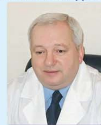
ФЕЩЕНКО Ю. І. директор, академік НАМН України, д.мед.н., Заслужений діяч науки і техніки України

ДЕРЖАВНА УСТАНОВА «НАЦІОНАЛЬНИЙ ІНСТИТУТ ФІЗИАТРИЇ І ПУЛЬМОНОЛОГІЇ ІМ. Ф. Г. ЯНОВСЬКОГО НАЦІОНАЛЬНОЇ АКАДЕМІЇ МЕДИЧНИХ НАУК УКРАЇНИ»