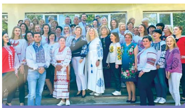
КНП «Київська міська клінічна лікарня № 11»