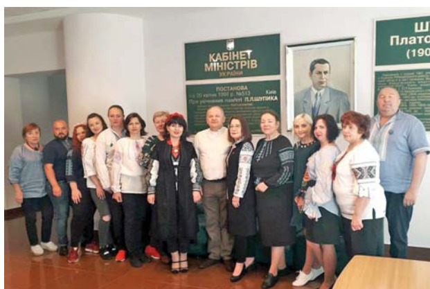
Національний університет охорони здоров'я України імені П. Л. Шупика