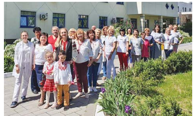
КНП «Дитяча клінічна лікарня № 7» Печерського району міста Києва