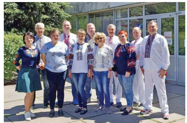
КНП «Київська міська клінічна лікарня швидкої медичної допомоги»