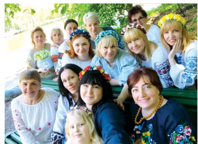
КНП «Консультативно-діагностичний центр» Голосіївського району м. Києва