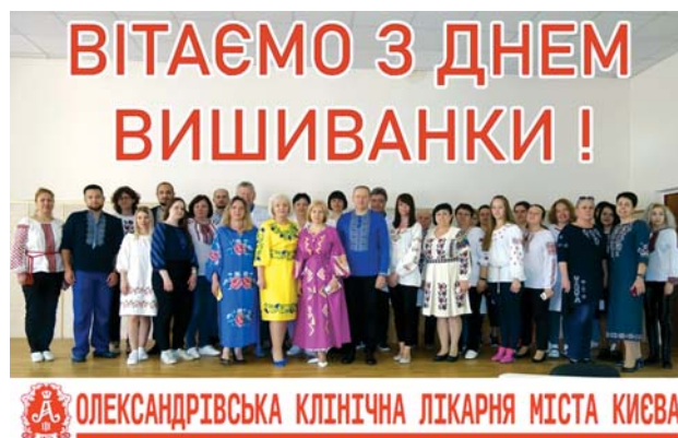
КНП «Олександрівська клінічна лікарня м. Києва»