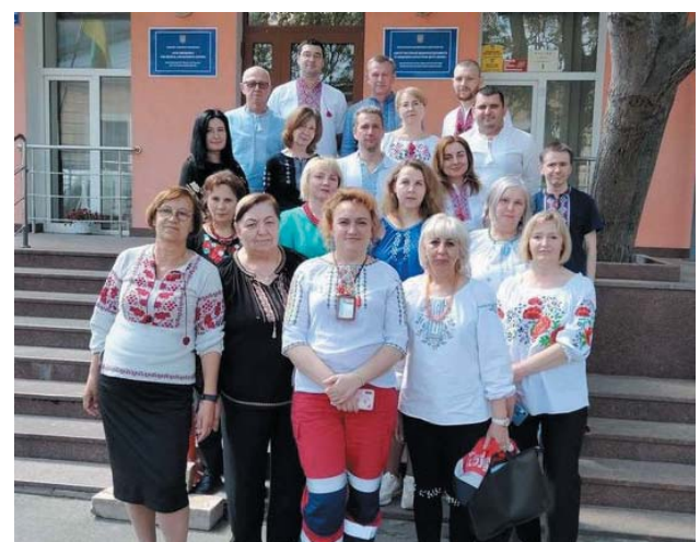
КНП «Центр екстреної медичної допомоги та медицини катастроф міста Києва»

Редакція не завжди поділяє думки авторів публікацій. За достовірність фактів і цифр відповідальність несе автор