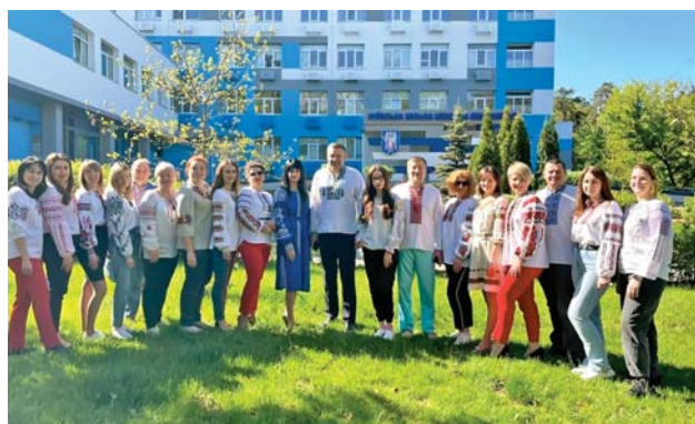
КНП «Київська міська клінічна лікарня № 7»