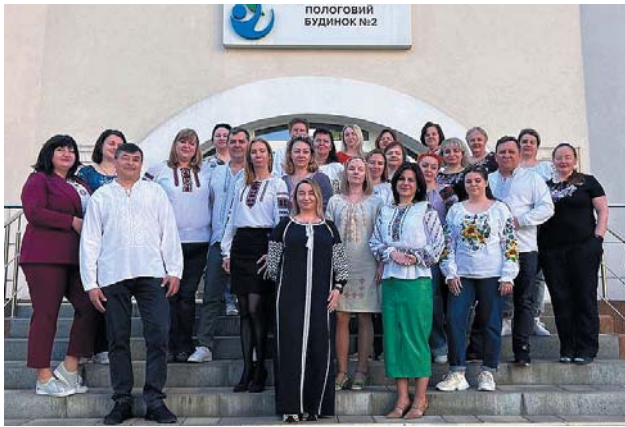
КНП «Київський міський пологовий будинок № 2»