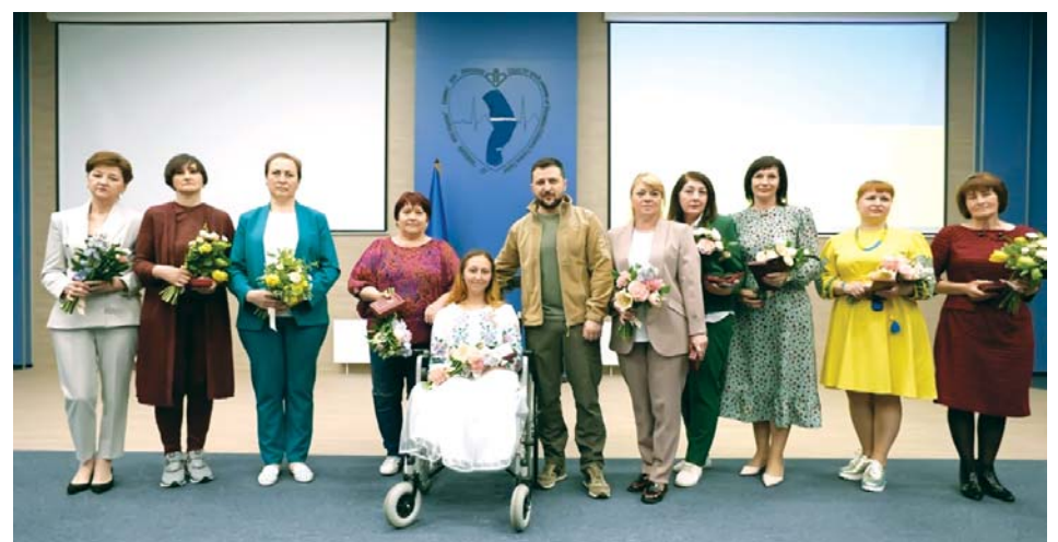
Адміністрація та профком центру

Присутні також вшанували хвилиною мовчання пам'ять медичних сестер, які загинули, рятуючи захисників України.