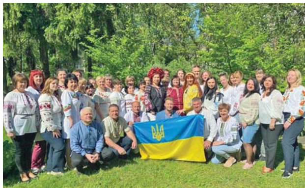
КНП «Київська міська клінічна лікарня № 4»