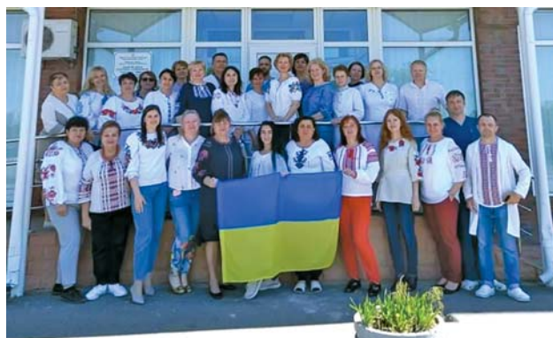
КНП «Київська міська дитяча клінічна лікарня № 1»

У 2006 році в Україні запровадили особливе свято, що має символічний характер, – День вишиванки. З роками традиція стала популярною по всій території України, а дата її відзначення завжди припадає на третій четвер травня. У цьому році це було 19 травня .