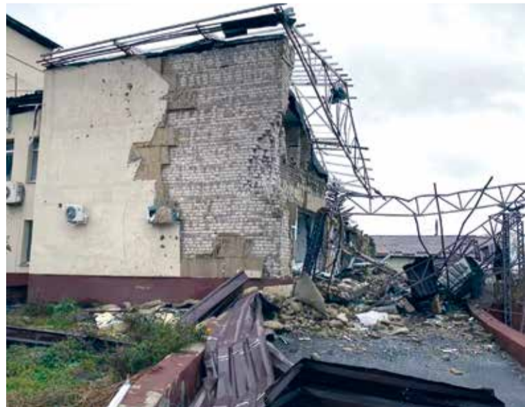
Розтрощений операційний блок Центральної міської лікарні м. Ізюм

Пацієнти з самого ранку підтягуються в приймальне відділення, кожен з них прийшов зі своїм наболілим. У цій місцевості окупація тривала