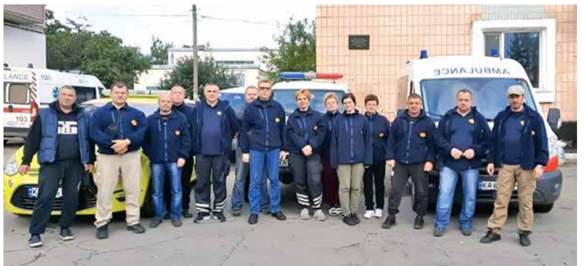
Фахівці спеціалізованої бригади медицини катастроф біля районної лікарні м. Балаклія Харківської обл. (25 вересня 2022)