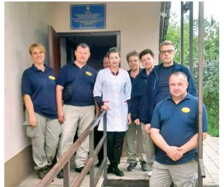
17 вересня 2022 р. спеціалізована команда медицини катастроф нашого закладу почала медичне обслуговування населення в с. Вербівка Балаклійського р-ну Харківської області

Спогади 7 квітня 2022 року. Коли наш автомобіль подолав кілометрів сорок, ми в'їхали в селище Андріївка. Їдучи по центральній вулиці, водій зменшив швидкість, серце похололо, всі завмерли: немає вцілілого