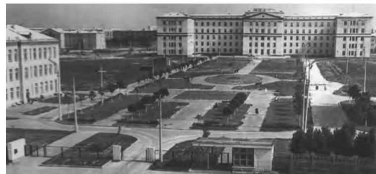
Загальний вигляд лікарні «Медмістечко» (червень 1964 р.).

праці ім. Ю. І. Кундієва НАМН України, ДУ «Інституту педіатрії, акушерства і гінекології», Інституту ендокринології та обміну речовин ім. В. П. Комісаренка, Національного наукового центру хірургії та трансплантології імені О. О. Шалімова. Нині розширюються зв'язки з іншими