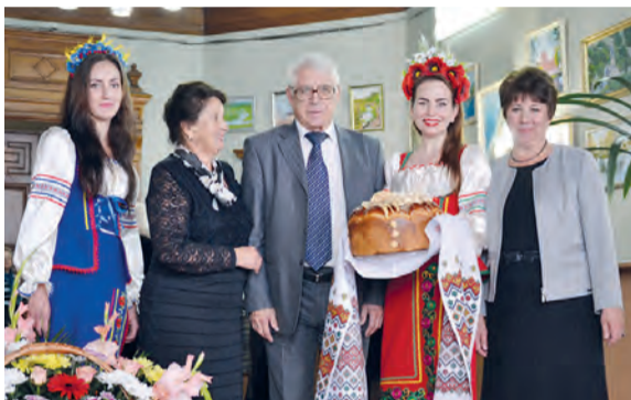
Ювілейні урочистості ННМБУ, 2015 рік