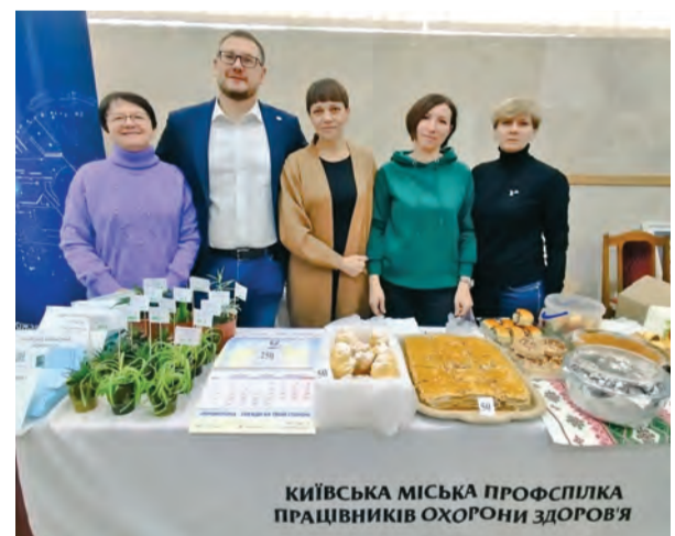
КИЇВСКА МІСЬКА ПРОФСІЛКА ПРАЦІВНИКІВ ОХОРОНИ ЗДОРОВ'Я

До дня Святого Миколая на підтримку Збройних Сил України, 5 грудня 2023 року в приміщенні Київської міськпрофради, пройшов благодійний ярмарок. Виконавчий апарат Ради профспілки спільно з головами територіальних та первинних профспілкових організацій долучилися до даного заходу, і, як результат, отримали перше місце за підсумками загального збору. Кожен учасник ярмарку мав можливість придбати цікаві і ексклюзивні речі, смаколики, які приготували талановиті майстри-спілчани, і так особисто підтримати ЗСУ. Особливо приємно зазначити особливо відповідальний підхід до участі в благодійному