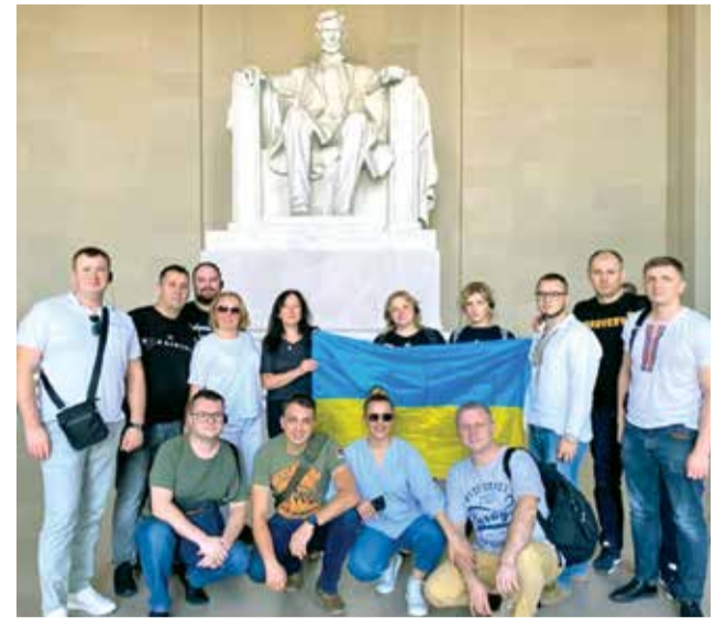
Ознайомлення з функціонуванням різних служб та структур системи ЕМД і МК в США за програмою «Open World»

безпрецедентною. Завдяки цьому Заклад і обласні центри ЕМД та МК отримали сучасні спеціалізовані транспортні засоби – джипи Toyota Land Cruiser 78. Саме завдяки ним команди МК долають бездоріжжя на деокупованих територіях, що дає змогу вчасно надавати якісну медичну допомогу пацієнтам і рятувати життя у найвіддаленіших населених пунктах.