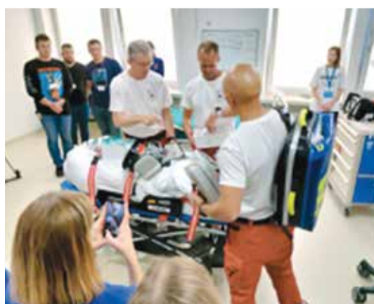
Підготовка інструкторів під час тренінгу «Team Leader Training» і «Bus Handover Training» (Республіка Польща)