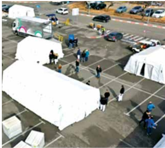
Спеціалізованою медичною бригадою постійної готовності проведено тестове розгортання мобільного госпіталю