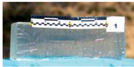
Фундаментальна науково-дослідна робота «Дослідження ранової балістики вогнепальної рани», виконана колективом науковців НАМН України та військових медиків вчених

Ці експериментальні моделі скорочують час на переведення наших знань і бойового медичного досвіду в практику. (Видання з узагальненням цих