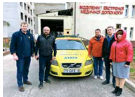
Авто містить медичне обладнання для надання медичної допомоги у різних надзвичайних ситуаціях

За міжнародними стандартами ВООЗ мобільні польові госпіталі бувають таких типів: мобільний, в структурі якого зна-