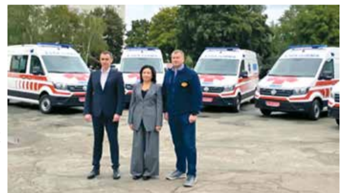
Передача спеціалізованого автотранспорту ШМД від співвласниці «Епіцентр К» Галини Гергеги. Міністр ОЗ України Віктор Ляшко і в. о. медичного директора Закладу Максим Максименко

Хочемо подякувати нашим партнерам, які працювали разом з нами, допомагали