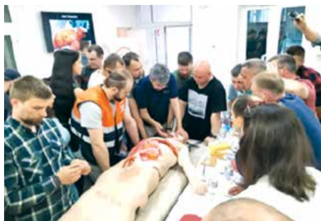
Лікарі-хірурги з різних регіонів України на симуляційному навчанні від «David Nott Foundation» «Hostile Environment Surgical Training (HEST)» («Хірургія в умовах надзвичайних ситуацій та катастроф»)