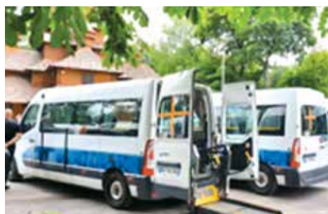
Спеціально обладнаний транспорт для перевезення людей, які перенесли ампутацію

Французька Асоціація «Медична і благодійна допомога Франція-Україна»